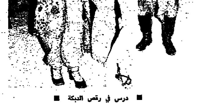
درس في رقص البكرة